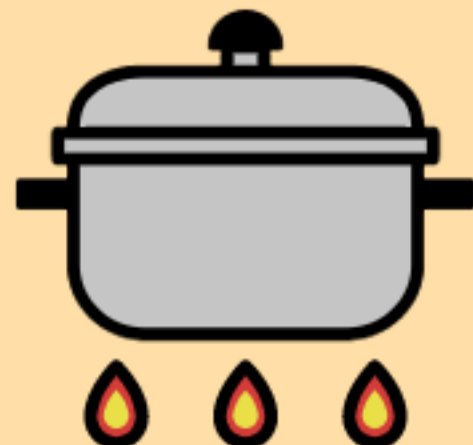
③ 끓여 먹기