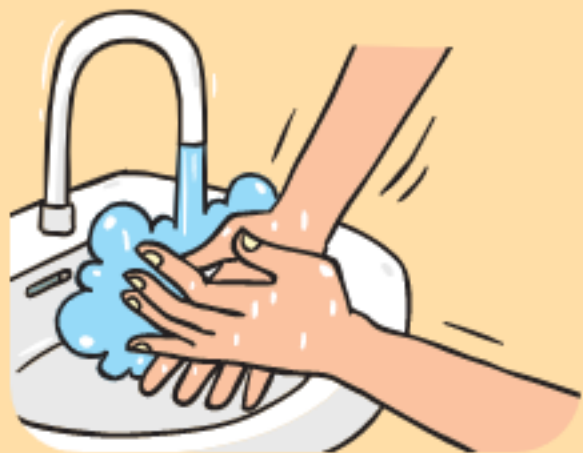
① 손 씻기