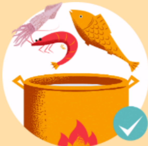
② 익혀 먹기